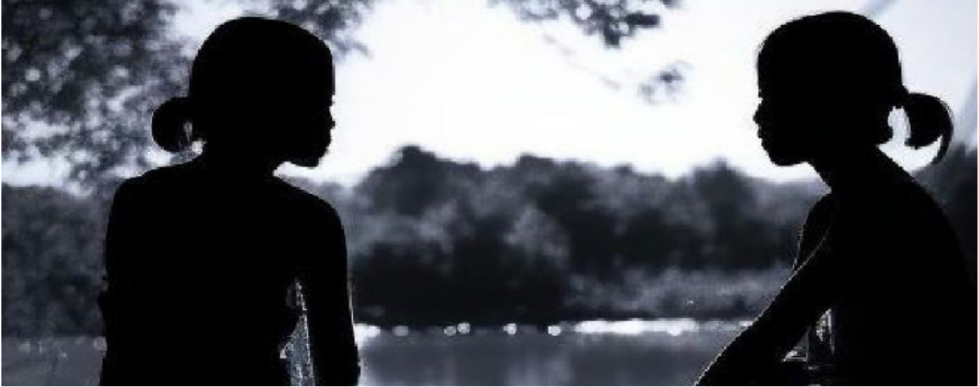
(ဓာတ်ပုံ။ ။ မွန်ပြည်နယ်ရှိ ကျေးရွာများတွင် ကလေးသူငယ်များအပေါ်လိင်အကြမ်းဖက်မှုများ ပိုမိုဖြစ်ပွားလာနေပြီး အာဏာပိုင်များက ဖမ်းဆီးအရေးယူမှုများ လုပ်ဆောင်ခြင်း မရှိကြောင်း မွန်အမျိုးသမီးအဖွဲ့များက ပြောသည်။)

စစ်တပ်၏မတရားအပြစ်ပေးမှုမှ လွတ်မြောက်ရန် တော်လှန်ရေးအင်အားစုများသည် ထွက်ပြေးတိမ်းရှောင်နေရသည်။ ၂၀၂၃ ဇန်နဝါရီလ (၁၂) ရက်နေ့တွင် ထားဝယ်ခရိုင် လောင်းလုံးမြို့နယ်ရှိ အမျိုးသားဒီမိုကရေစီအဖွဲ့ချုပ်ပါတီ ထောက်ခံသူများ၏ နေအိမ် (၅) လုံးကို စစ်တပ်နှင့် ၎င်းတို့၏လက်ကိုင်တုတ်ပြည်သူ့စစ်များက မီးရှို့ဖျက်ဆီးလိုက်ကြောင်း ဒေသခံမျက်မြင်များက ပြောသည်။ စစ်အာဏာရှင်စနစ်အောက်တွင် တာဝန်ထမ်းဆောင်လိုသူ (CDM) များနှင့် ၎င်းတို့၏မိသားစုဝင်များကို စစ်ကောင်စီက ပစ်မှတ်ထားနေသည်။ ညမထွက်ရအမိန့်ထုတ်ပြန်ထားသည့် တနင်္သာရီတောင်ပိုင်း ပုလောမြို့နယ်တွင် မတရားဖမ်းဆီးမှုများ ဆက်လက်ဖြစ်ပွားနေသည်။ CDM ကျောင်းဆရာဆရာမများ၊ ဌာနဆိုင်ရာအသီးသီးမှ ဝန်ထမ်းများနှင့် အုပ်ချုပ်ရေးမှူးဟောင်းများကို စစ်ကောင်စီက လိုက်လံဖမ်းဆီးနေသည်။