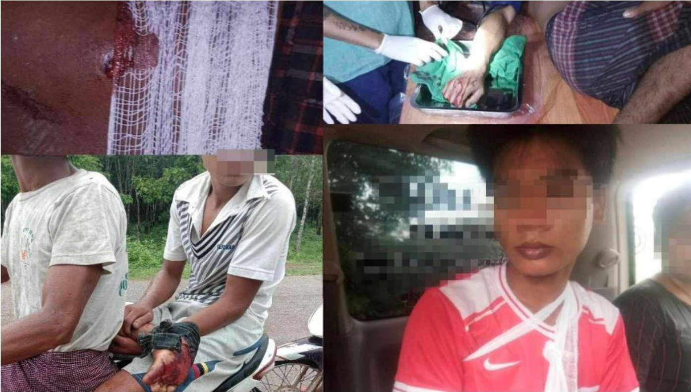
(ဓာတ်ပုံ။ ။ ဇွန်လ (၁၉) ရက်နေ့ ညနေ (၆) နာရီ မိနစ် (၂၀) တွင် မုဒုံမြို့နယ် အဘစ်ကျေးရွာအခြေစိုက် အမှတ် (၃၁၈) အမြောက်တပ်ရင်းက ဝင်းရေးမြို့နယ် တံခွန်တိုင်ကျေးရွာအတွင်းသို့ ၁၂၀ မမ လက်နက်ကြီးဖြင့် အတွဲလိုက်ရမ်းသမ်းပစ်ခတ်ခဲ့သဖြင့် ဒေသခံပြည်သူ အနည်းဆုံး (၃) ဦး ထိခိုက်ဒဏ်ရာ ရရှိခဲ့သည်။)

ပြည်သူလူထုမှာ စစ်တပ်က ၎င်းတို့အပေါ်စနစ်တကျကျူးလွန်နေသည့် အကြမ်းဖက်မှုများကို ခါးစည်းခံနေရသည်။ စစ်တပ်က အာဏာနှင့် တရားဝင်မှုကို ငမ်းငမ်းတက်လိုချင်နေသည်။ ထို့ကြောင့် ၎င်းတို့ကို ဆန့်ကျင်သူမှန်သမျှကို ပစ်မှတ်ထားတိုက်ခိုက်နေသည်။ စစ်တပ်ဆန့်ကျင်မှုအားကောင်းသည့်နေရာများတွင် ကျေးရွာများကို မီးရှို့ဖျက်ဆီးခြင်း၊ လက်နက်ကြီးလက်နက်ငယ်တို့ဖြင့် ရမ်းသမ်းပစ်ခတ်ခြင်း၊ ညှဉ်းပန်းနှိပ်စက်ခြင်း၊ မတရားဖမ်းဆီးခြင်းနှင့် မတရားခိုင်းစေခြင်း(ပေါ်တာဆွဲခြင်း)များဖြင့် စစ်တပ်က ပြင်းပြင်းထန်ထန်တုံ့ပြန်သည်။