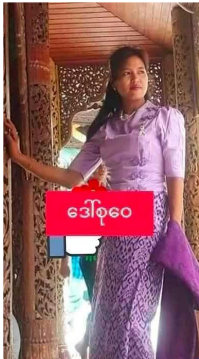
(ဓာတ်ပုံ။ ။ ဒေသခံများ၏ပြောကြားချက်အရ ဇွန် (၂၀) ရက်နေ့ နံနက် (၇) နာရီတွင် ရေဖြူမြို့နယ် ကံပေါက်ဒေသ ဖောင်တောကျေးရွာမှ အသက် (၄၀) နှင့် (၅၀) ကြားရှိ အမျိုးသမီး (၄) ဦးကို မောရဝတီရေတပ်က ဖမ်းဆီးခဲ့သည်။)