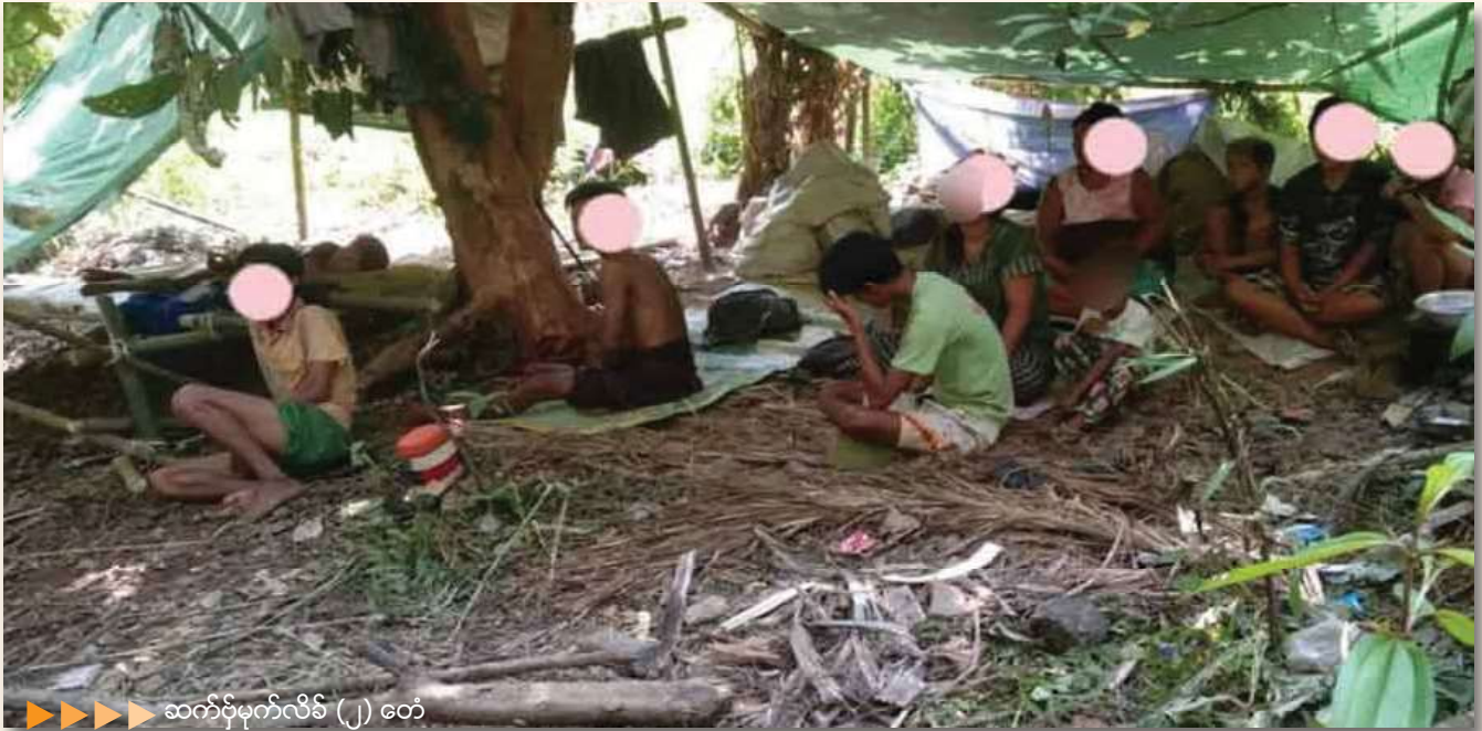
ဆက်ဗိုမှိုဟ်လိမ် (၂) တေံ