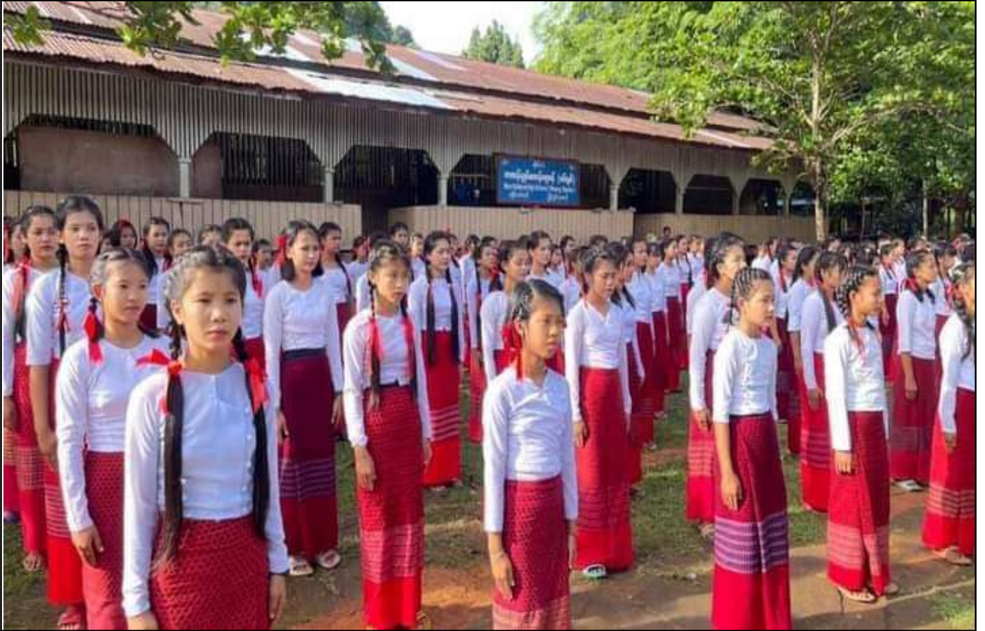
ရောန် ၁၂၊ ၂၀၂၄

၂၀၂၄ ဂိတုရောန် (၁၁) ရ် စရင်အံင် တန်လုပ်တက္ကသိုလ် သွက်သွာံ ၂၀၂၃-၂၄ တိတ်ကျင်တဲ နှစ်ဘာကောန်ဂကူမန် မွဲ သွင်ကမ္မတီ ပရင်ပညာကောန်ဂကူမန်ဂ် လွှတ်ကွေးဘာအံင် နွံ (၁၀) တွမ်ရ ဝံတီကေတ်။