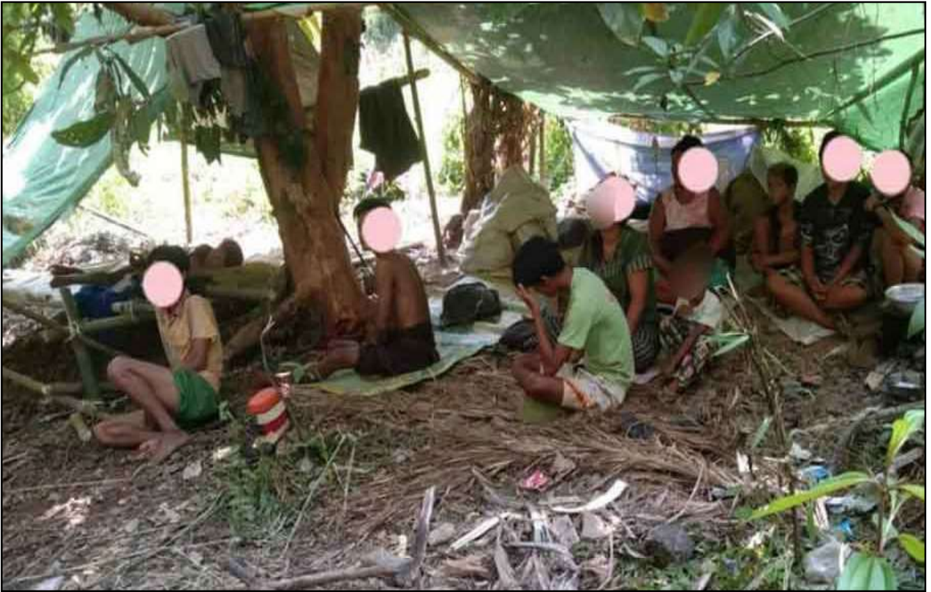
ကျောန် ၁၁၊ ၂၀၂၄

ဟိုတ်နုပဋိပက္ခလွဟ်ကို ဟိုတ်နုပန်ခိုင်ခိုင်ကို လွဟ်ဖျော်ကို ဟိုတ်နုပန်ခိုင် နုကိုကွင်ကျာကိုရ ပွဲသွာံ ၂၀၂၄ ဂိတုမေကံ ညးချင်ကွာန် လွဟ် (၅၀,၀၀၀) ပြင် နုကို ခရိုင်ထဝါ ကော် ခရိုင်ဗိက် ရးတနင်သီရံ ထောံသို့ ထောံဌာန်တို အဲပီဒိုင်သဲ ပွာန်ရံ ဝံတီကောတ်။