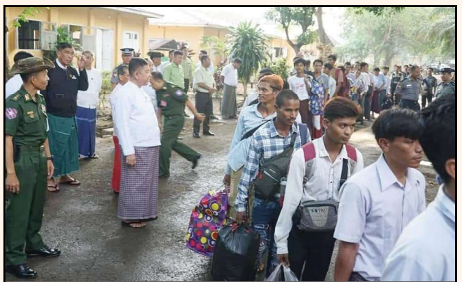
မေ ၂၈၊ ၂၀၂၄

သွက်ဂွံယိုက်ဂွေင် တာလျိုင်ပွာန်ဂ် ကင်ဇြိပွာန် ပတပ်ကျင် လွှာ်သွာကမောန်ဆဲပြင် ကော် ရဲသုင်ဂဠုမာ်တံ