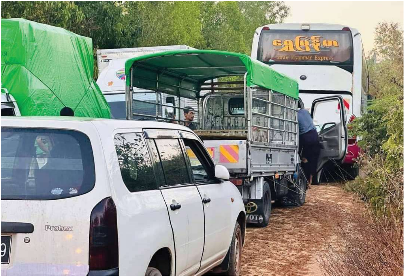
မေ ၁၅၊ ၂၀၂၄

၂၀၂၄ ဝိတုမေ (၃) ရ် ဒဲဒပ်ပွန်ဂတးတံ လုပ်ပန်ဗျိပ်ဒပ်ချာ် ကံင်ဇြိပွာန် မွဲပွဲကအ်ညွတ် ပွိုင်ချင်ပါလျိုင် ပွိုင်ချင်ရေဝ် တွဲရးမန် ရ။